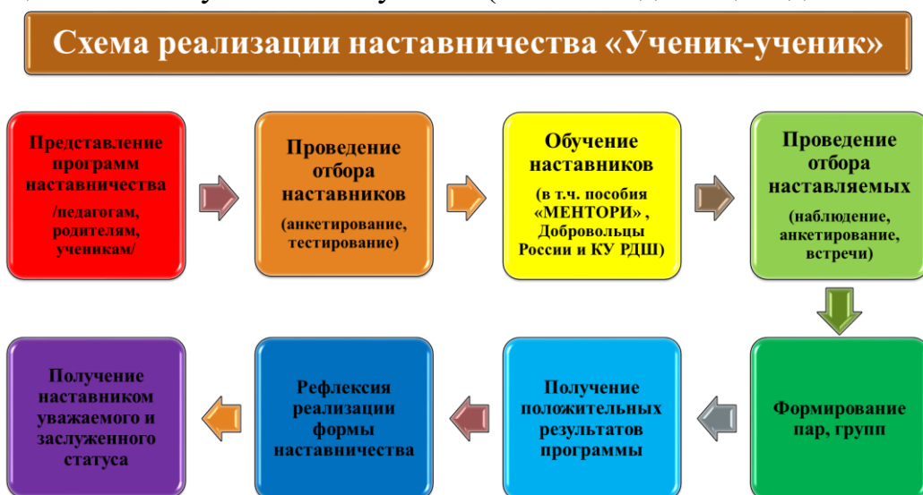
Рис.1. Описание схемы реализации наставничества «ученик-ученик»

Целью взаимодействия наставника и наставляемого является разносторонняя поддержка обучающегося с особыми образовательными/социальными потребностями либо временная помощь в адаптации к новым условиям обучения (включая адаптацию детей с ОВЗ).